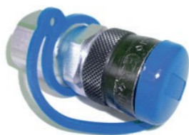
Самоуплотняющаяся полумуфта с защитным колпачком