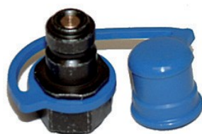
Самоуплотняющийся ниппель с защитным колпачком

Минимальное давление разрыва составляет 4500 bar, а минимальный радиус изгиба 150мм. Все шланги высокого давления соответствуют требованиям директивы Европейского союза по оборудованию и имеют маркировку CE.