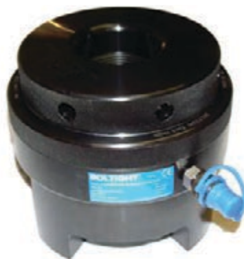
Инструмент для работы под давлением 1000 бар

Болтайт (Boltight) поставляет стандартные инструменты для натяжения болтов, предназначенные для работы под давлением 1000 бар и 1500 бар. Все инструменты Болтайт (Boltight), шланги и насосы имеют цветовую маркировку для обозначения максимального рабочего давления. Инструменты Болтайт (Boltight) соответствуют требованиям Директивы ЕС по оборудованию, работающему под давлением.