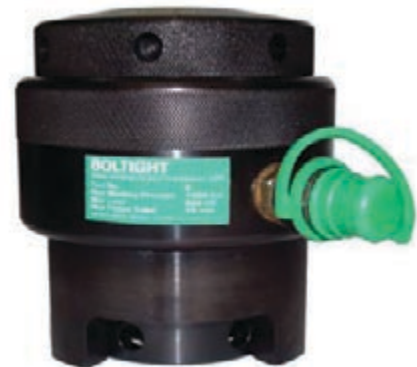
Инструмент для работы под давлением 1500 бар